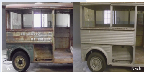
Entrosten und Entlacken