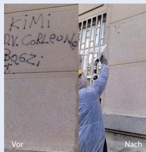
Fassadenreinigung - Antigrafitti

CRYONOMIC®, technologischer Vorsprung durch Innovative Strahltechnik!